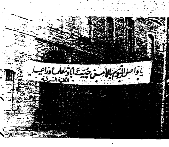
لائحة ترهب بالمطران فرج